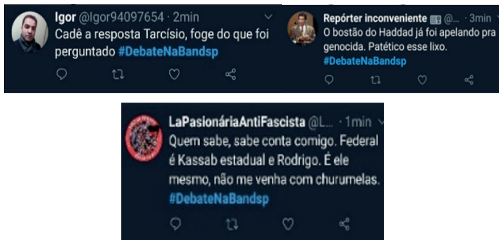
Figura 3 - Recorte das mensagens negativas sobre os candidatos

dicado no levantamento da valoração das postagens, em que 54.5% foram classificadas como negativas.