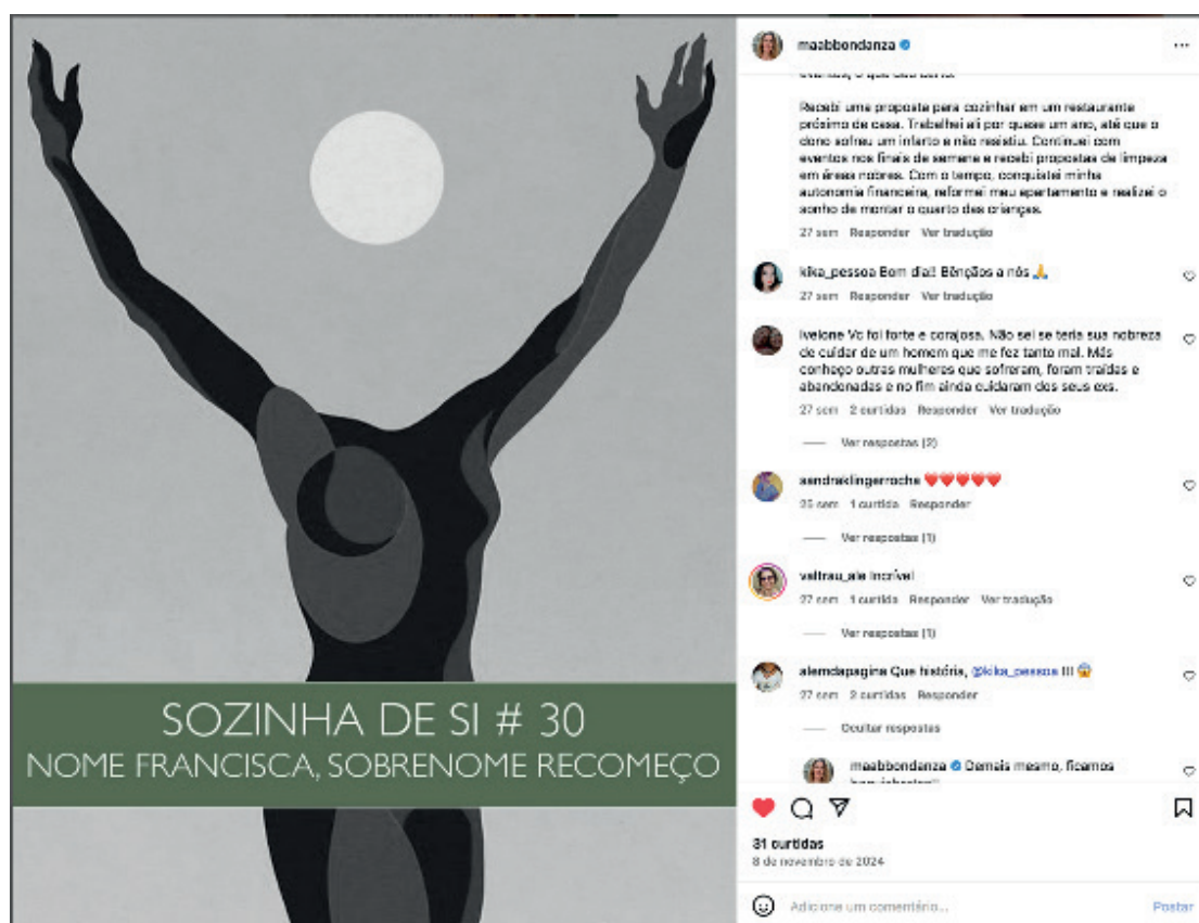
FIGURA 2 – Exemplos de depoimentos a partir da escuta do Podcast Sozinha de Si