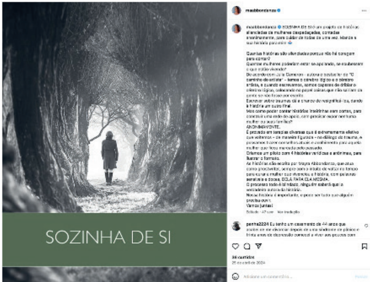
FIGURA 1 – Chamado para participação do Projeto Sozinha de Si