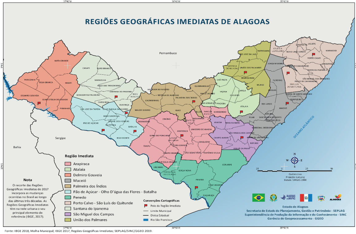
Figura 1: Mapa das Regiões Imediatas de Alagoas