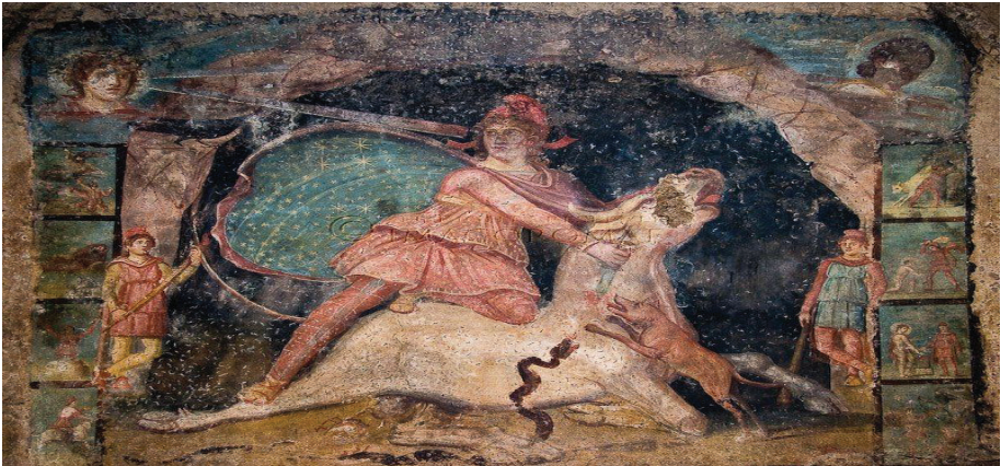
Figura 1: Mitra sacrificando o touro enquanto é observado pelo deus sol, no canto superior esquerdo. Afresco do mitreu de Marino, Itália, século III d.C.