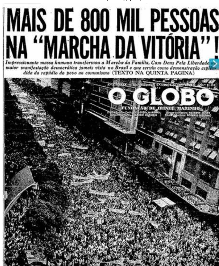
Imagem 11 – “ Marcha da Vitória ”, Rio de Janeiro, 02 de abril de 1964.

18