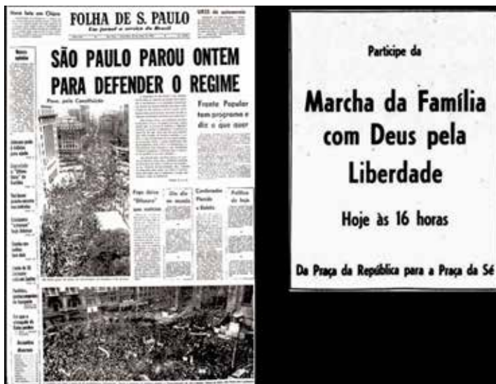
Imagem 9 – Edição de 20 de março de 1964 do Jornal Folha de S. Paulo, aborda ‘Marcha da Família, com Deus, pela Liberdade’.