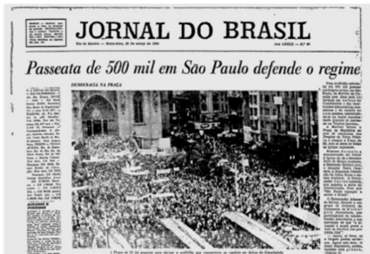
Imagem 10 - Marcha da Família com Deus , em apoio aos militares. Jornal do Brasil: Sexta-feira, 20 de março de 1964.