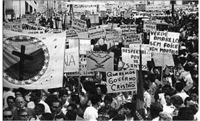
Imagem 8 - Marcha da Família reuniu cerca de 500 mil pessoas na praça da Sé, em São Paulo, no dia 19 de março de 1964 Fonte: CPDoc JB/Jornal do Brasil. 15