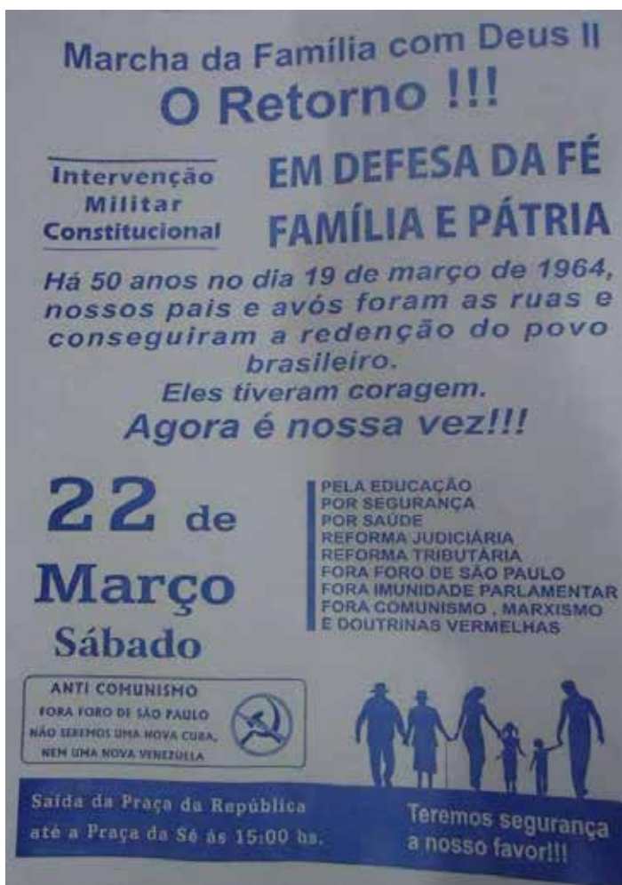
Imagem 12 – O Retorno da Marcha da Família com Deus

As Marchas tiveram o apoio da ala conservadora religiosa brasileira, das classes médias, do empresariado e de diversos grupos sociais de direita, na busca da conservação da família, moral e dos valores, liderando toda a campanha antes e após o golpe civil-empresarial-militar e auxiliando na propagação do imaginário social do “moralismo anticomunista” no centro da ideologia do regime. Não é por menos que o registro da Marcha da Família com Deus pela Liberdade no Orvil aparece no final do capítulo intitulado “A Revolução Democrática de 1964”, pois foi uma variedade de protestos que ensejou o golpe militar e regozijou com a tomada do poder. Portanto, a Marcha pode ser classificada como expressão do protesto e do triunfo no que se refere aos temas intrinsecamente defendidos no regime militar.