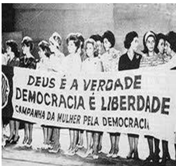
Imagem 5 – A Campanha da Mulher pela Democracia - CAMDE

SENTIMENTOS”. Essa propaganda se encontra na contracapa de uma revista para o público feminino dos anos 60 e indica a relevância das associações cívicas e religiosas femininas que surgiram nas décadas de 1950 e 1960 no panorama geral político brasileiro. Grupos como União Cívica Feminina (UCF), de origem paulista, e uma associação de mulheres da Guanabara intitulada Campanha da Mulher pela Democracia (CAMDE), de origem carioca, entre outras, se mostraram como uma força potente de mobilização e que tiveram grande protagonismo na realização dos eventos que ocorreram no âmbito das Marchas da Família por todo o país. A presença das mulheres nas Marchas da Família esteve envolta ao simbolismo (e/ou estereótipo acerca) do feminino, isto é, encarnou-se o papel do que, nessa perspectiva, lhe era próprio: da mãe enquanto protetora dos costumes, do lar, da família; aquela pertencente ao privado , mas que se tornou presente no público . A mulher (mãe, religiosa, conservadora) foi transfigurada em símbolo do movimento, verdadeiras representantes do modo de vida, dos valores religiosos e da moral cívica tão almejada para a nação (CORDEIRO, 2021; PRESOT, 2004).