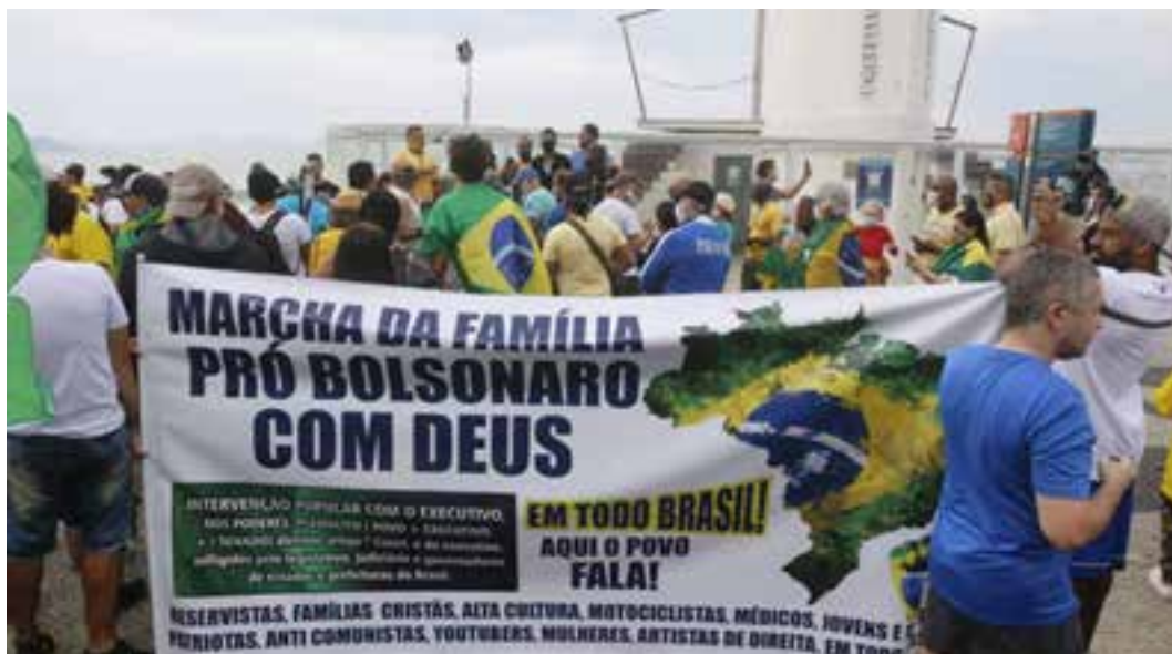
Imagem 15 – Marcha da Família pró Bolsonaro com Deus