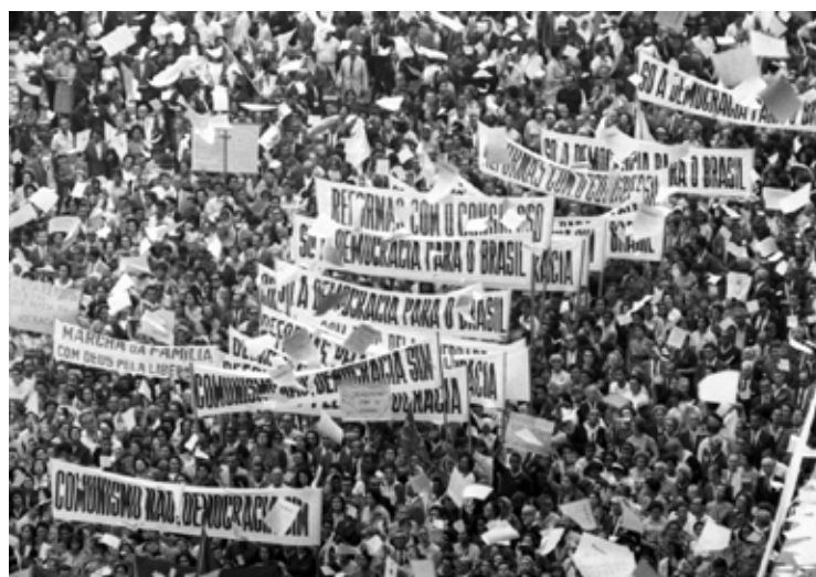
Imagem 6 - Marcha da Família com Deus pela Liberdade em São Paulo, 19 de março de 1964.