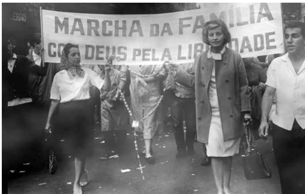
Imagem 1 – Marchadeiras com Rosário

Era a “Marcha da Família com Deus pela Liberdade”, um movimento de cunho nacional em defesa do regime e da Constituição e que já se realizara, com êxito, em São Paulo, Belo Horizonte, Santos e Porto Alegre. Programada com antecedência, no Rio de Janeiro, transformara-se, de protesto contra o caos do governo anterior, em júbilo pela vitória da democracia. (NASCIMENTO e MACIEL, 2012, p. 111-112)