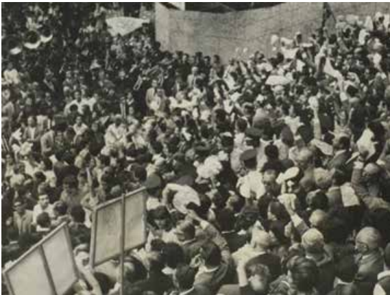
Imagem 7 - Manifestantes na Marcha da Família com Deus pela Liberdade , em 19 de março de 1964 na Praça da Sé, em São Paulo. 14