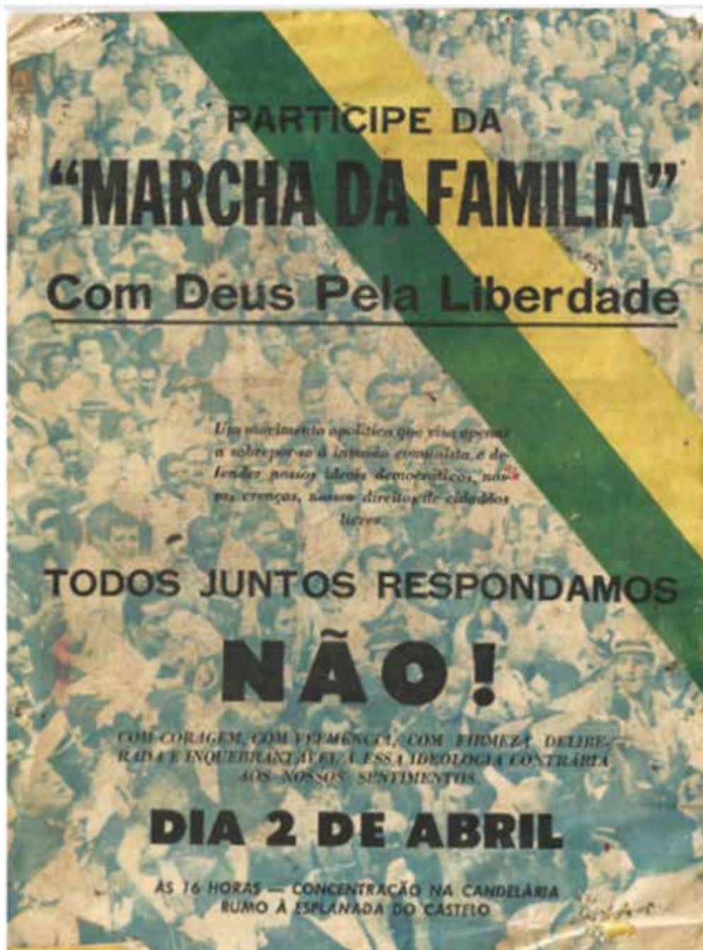
Imagem 4 - Convocação para “MARCHA DA FAMÍLIA Com Deus Pela Liberdade”, 29 de março de 1964 – “Revista Feminina”.